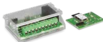
SCHEDA +MODULO BLUETOOTH = EVO BLUE